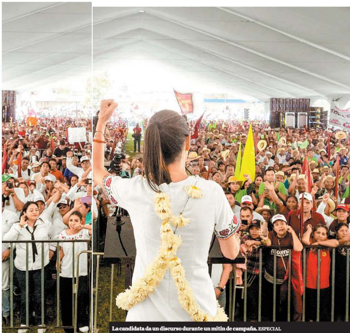
La candidata da un discurso durante un mitín de campaña. ESPECIAL

los herederos de los patriotas que defendieron su país y denunció a la oposición como los herederos corruptos de los traidores que invitaron a un emperador extranjero a gobernarlos.