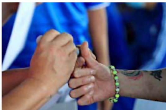
■ En noticieros y en carteles que colocaron en el penal, pudieron conocer las plataformas de las tres candidaturas.

Fueron los dos últimos de los 838 presos en prisión preventiva, de ellos 94 mujeres, que ejercieron su voto en este reclusorio del Esta-