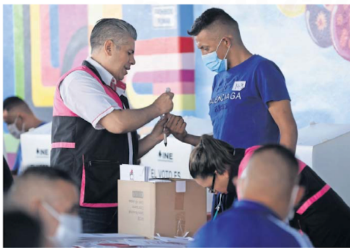
Personal del Instituto Nacional Electoral ingresó al Penal de Barrientos para captar el voto de los reclusos de este lugar.