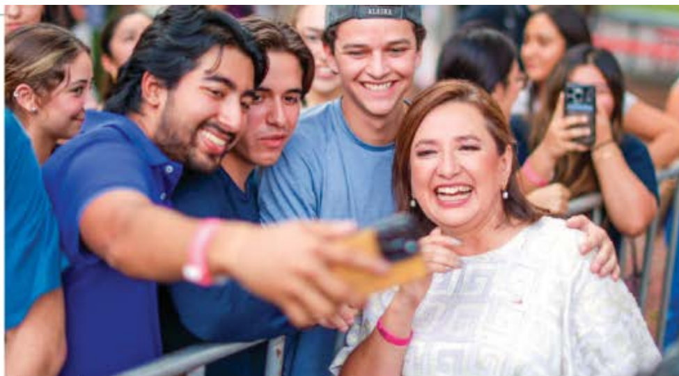
XÓCHITL GÁLVEZ, candidata presidencial por FCXM, ayer, con estudiantes del Tec de Monterrey.