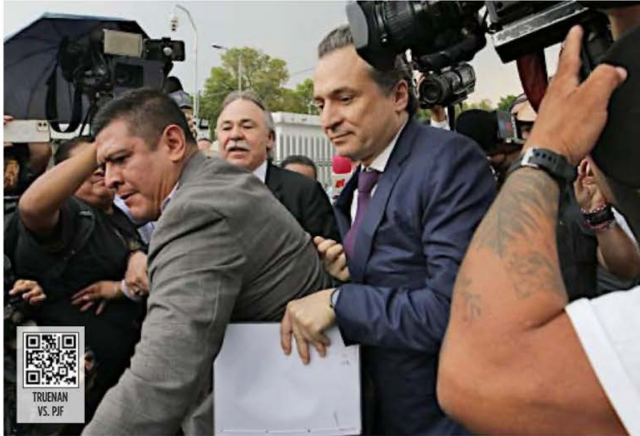
Emilio Lozoya, ex director de Pemex, acudió ayer a una audiencia al Reclusorio Norte por el Caso Agronitrogenados.

Advierte Fiscalía sobre denuncia; solicita juzgador fallo de tribunal