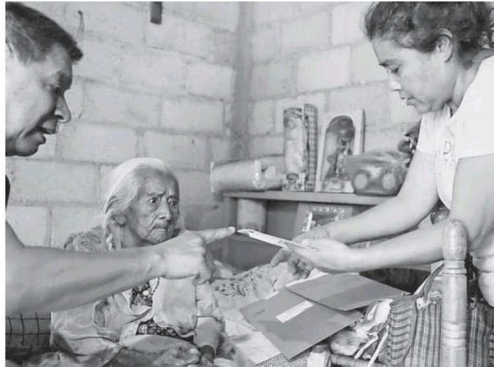
A cada persona se le entregarán cinco boletas

La Junta Local del INE en la entidad dio a conocer que los distritos 7 Cuautitlán Izcalli, 8 Tultitlán, 15 Ciudad Adolfo López Mateos, 17 Ecatepec, 19 Tlalnepantla, 22 Naucalpan y 35 Tenancingo son los que