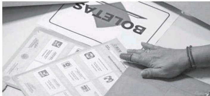
Sólo cuatro distritos federales no registraron ninguna persona

concentran el 50% de la votación anticipada en la entidad mexiquense, con 109 votos.