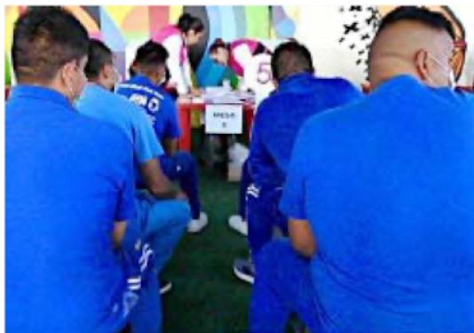
■ De los 30 mil 391 presos que pueden votar por la Presidencia, entre lunes y martes lo hicieron cerca de 10 mil.