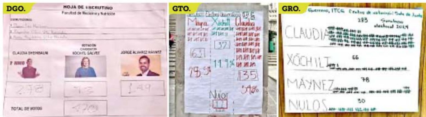
■ Resultados del simulacro electoral en las universidades de Guanajuato, Juárez de Durango y Tecnológico de la Costa Grande.