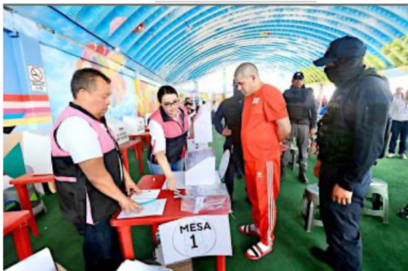
EJERCEN DERECHO. En el penal estatal de Barrientos, en Tlalnepantla, Estado de México, pudieron emitir su voto dos reos de alta peligrosidad que permanecen en prisión preventiva.