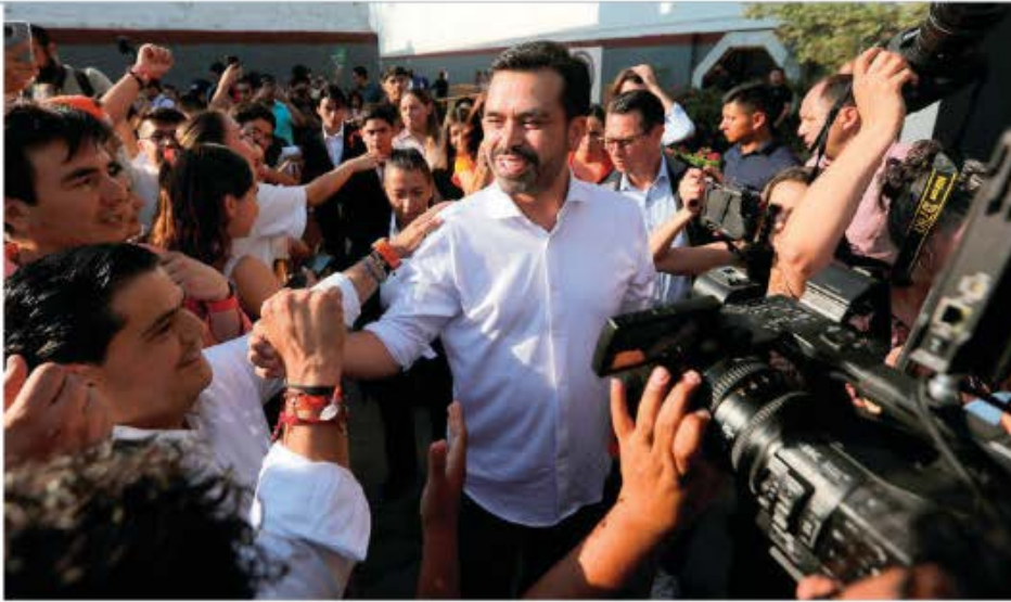
JORGE ÁLVAREZ MÁYNEZ, candidato presidencial por Movimiento Ciudadano (MC), ayer durante un encuentro estudiantil con alumnos de la Universidad de Londres Querétaro.

“TENEMOS un problema muy grave de educación financiera en el que muchas personas están endeudadas con Infonavit o con una pensión muy baja pues nunca tuvieron un asesoramiento” Jorge Álvarez Máynez Abanderado presidencial por MC ”